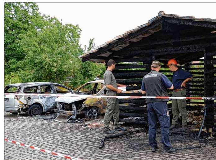
Gestern Morgen: Mitarbeiter der Polizei haben ihre Arbeit zur Suche nach der Brandursache aufgenommen.