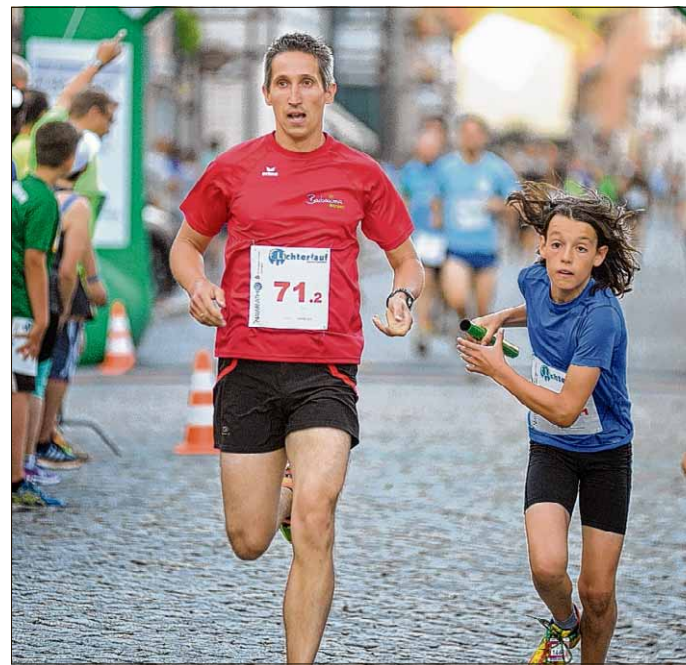
Staffel- und Einzelläufer trafen sich nach den jeweiligen Runden in der Wechselzone.